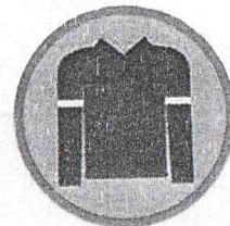
Нашитые или прикрепляемые полоски, значки

ПРИ ПЕРЕХОДЕ ДОРОГИ И ДВИЖЕНИИ ПО ОБОЧИНАМ ИЛИ КРАЮ ПРОЕЗЖЕЙ ЧАСТИ В ТЕМНОЕ ВРЕМЯ СУТОК ИЛИ В УСЛОВИЯХ НЕДОСТАТОЧНОЙ ВИДИМОСТИ ПЕШЕХОДАМ РЕКОМЕНДУЕТСЯ, А ВНЕ НАСЕЛЕННЫХ ПУНКТОВ ПЕШЕХОДЫ ОБЯЗАНЫ ИМЕТЬ ПРИ СЕБЕ ПРЕДМЕТЫ СО СВЕТОВОЗВРАЩАЮЩИМИ ЭЛЕМЕНТАМИ И ОБЕСПЕЧИВАТЬ ВИДИМОСТЬ ЭТИХ ПРЕДМЕТОВ ВОДИТЕЛЯМИ ТРАНСПОРТНЫХ СРЕДСТВ (п. 4.1. ПДД РФ).