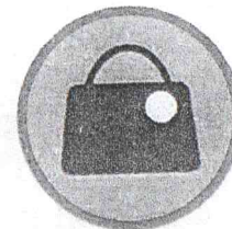
Круглые эмблемы, прикрепляемые к сумкам