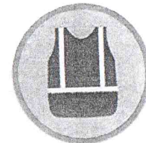
Сигнальные жилеты со световозвращающими элементами

ПРОКУРАТУРА Красногвардейского района разъясняет