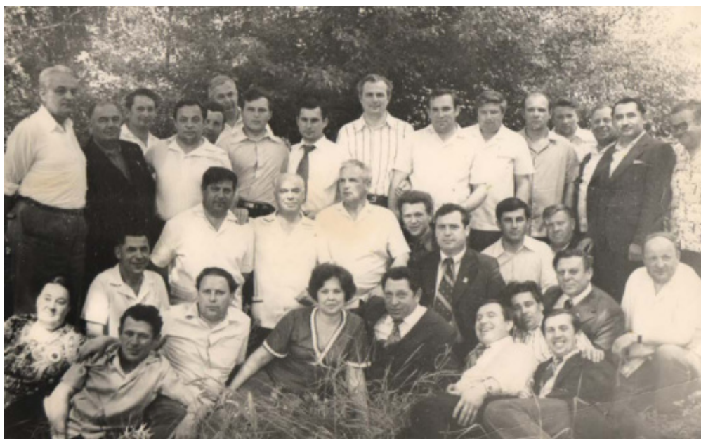
Руководители района, п. Красногвардейское, 1977 год