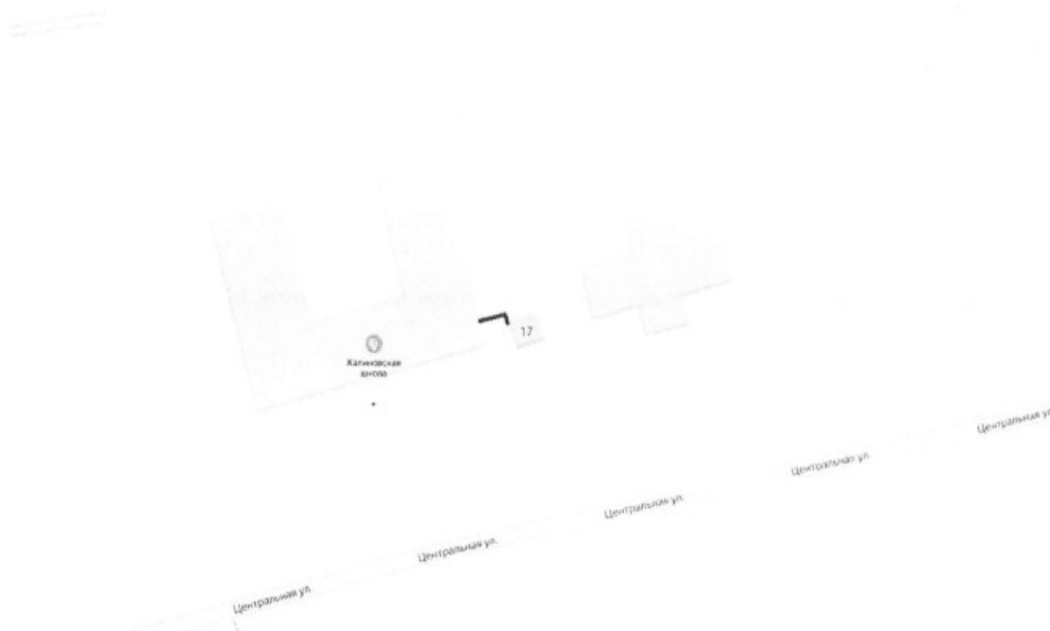
Рисунок 1. Схема тепловых сетей котельной Калиново СОШ